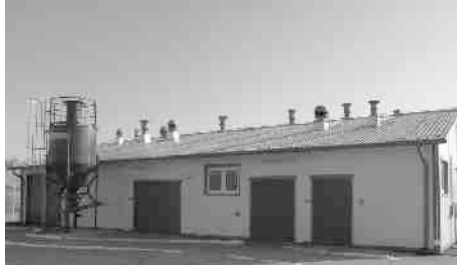
Sztandarowa inwestycja I kadencji - Oczyszczalnia ścieków

Ale największym wyzwaniem, przed którym stanęły nowe władze, było wyprowadzenie gminy z cywilizacyjnej zapaści, w jakiej się znajdowała. Brak dostępu do wody pitnej, brak oczyszczalni, kanalizacji, gazyfikacji, a nawet środków łączności to były najważniejsze zadania, które w pierwszej kolejności należało rozwiązać. Niestety, nakłady finansowe potrzebne na ich realizację były dla gminy nie do udźwignięcia. Jednak determinacja samorządowców sprawiła, że wiele z tych zadań wykonano. Obroty budżetu gminy w pierwszej kadencji wyniosły 93 miliardy 140 mln zł. Wykonano wtedy zadania inwestycyjne na kwotę 55 miliardów 659 mln zł. Olbrzymim sukcesem było pozyskanie dodatkowych funduszy w wysokości 44 miliardów 399 mln zł z innych źródeł. Dzięki temu, w stosunkowo krótkim czasie udało się wykonać najpilniejsze zadania, które zdecydowanie poprawiły gminną i miejską infrastrukturę. Od tamtej pory minęło już ponad 20 lat, warto zatem najważniejsze z nich przypomnieć: