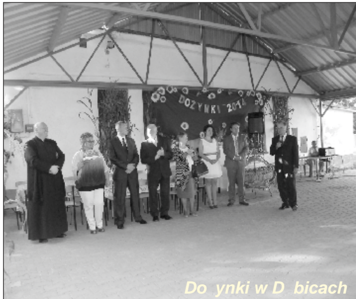
Dożynki w Dębicach

Dożynki nie były tak okazałe jak gminne, ale mieszkańcy poszczególnych sołectw włożyli w ich przygotowanie sporo wysiłku organizacyjnego. Pomysłów nie brakowało, a zabawa była równie dobra jak na dożynkach gminnych. Organizatorom wiejskich dożynek serdecznie dziękujemy i gratulujemy.