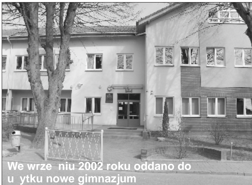
We wrześniu 2002 roku oddano do użytku nowe gimnazjum

- Gmina odkupiła od Starostwa Powiatowego w Goleniowie budynek byłego Internatu w Maszewie przy ul. Nowogardzkiej i adaptowała go na mieszkania komunalne. W 2005 roku