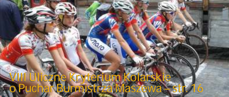
VIII Uliczne Kryterium Kolarskie o Puchar Burmistrza Maszewa – str. 16