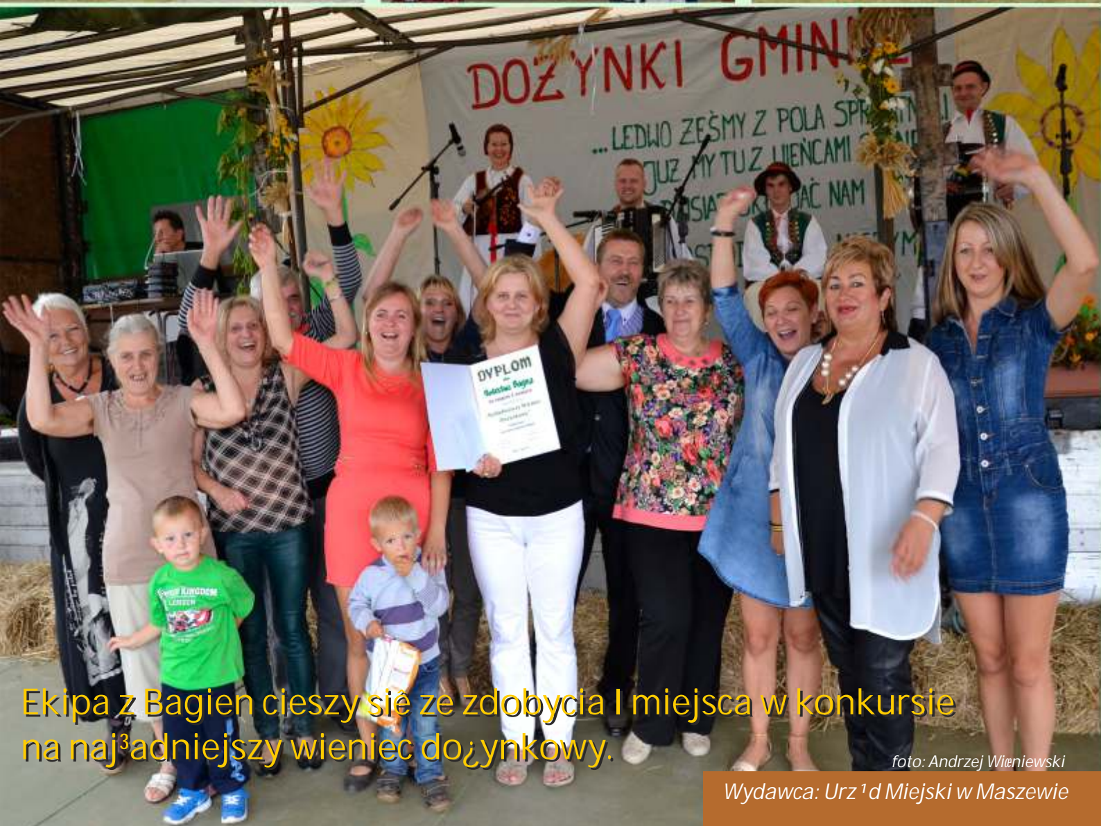
Ekipa z Bagien cieszy się ze zdobycia I miejsca w konkursie na naj 3 adniejszy wieniec dożynkowy.