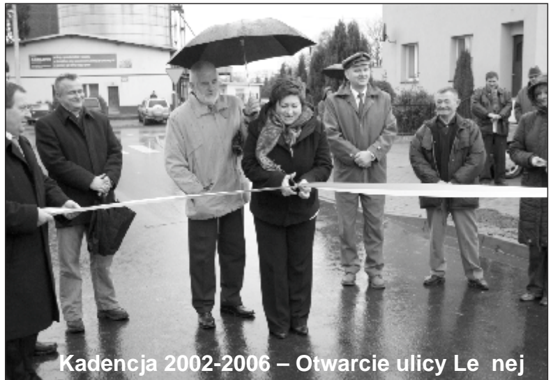
Kadencja 2002-2006 – Otwarcie ulicy Leńskiej

Powstały kolejne place zabaw na terenach wiejskich, a już istniejące - doposażono. To samo dotyczy boisk sportowych. Powstały kolejne w Wałknie, Godowie i Mokrym. Trwa rekultywacja terenów i przygotowanie kolejnych – w Korytowie i Tarnowie. W 2008 roku otwarto nowy plac zabaw w Maszewie przy ul. H. Sawickiej;