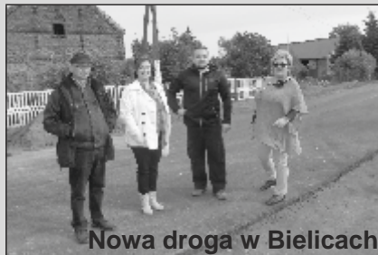
Nowa droga w Bielicach