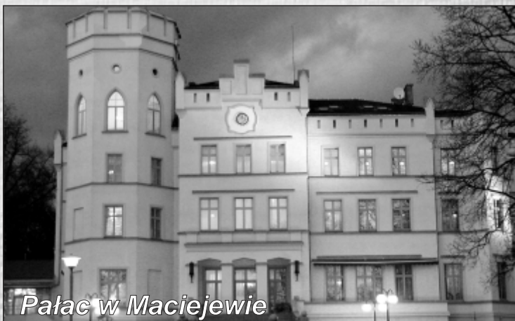
Pałac w Maciejewie

Biuletyn Maszewski - bezpłatny kwartalnik Redaktor Naczelny: Arkadiusz Poczubut. Wydawca: Urząd Miejski, Plac Wolności 2, 72-130 Maszewo, tel. 91 402 33 80, e-mail: urzad@maszewo.pl Skład i druk: Drukarnia ARKUSZ Goleniów, ul. Krzywoustego 31, tel.: 91 407 21 70