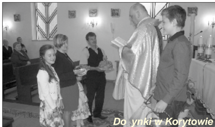
Dożynki w Korytowie