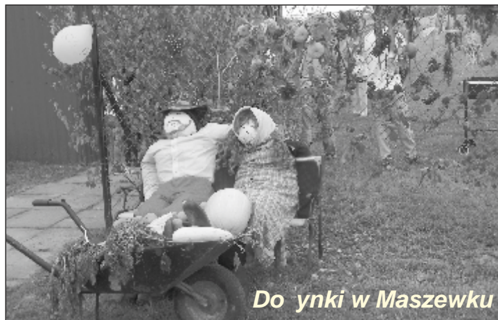
Dożynki w Maszewku