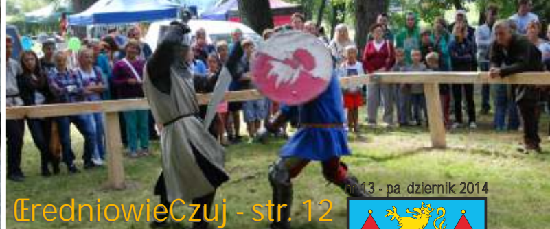
ŁredniowieCzuj - str. 12