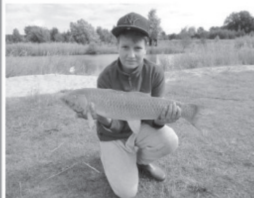
Karol z br zowym medalem i rekordowym okazem amura.