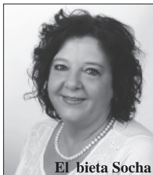
El bieta Socha

Okr g wyborczy nr 15: cz miasta Maszewo obejmuj ca ulice: Głowackiego, Grunwaldzka, Ko ciuszki, ks. Kazimierza wietli skiego, Mariana Buczka, Sienkiewicza.