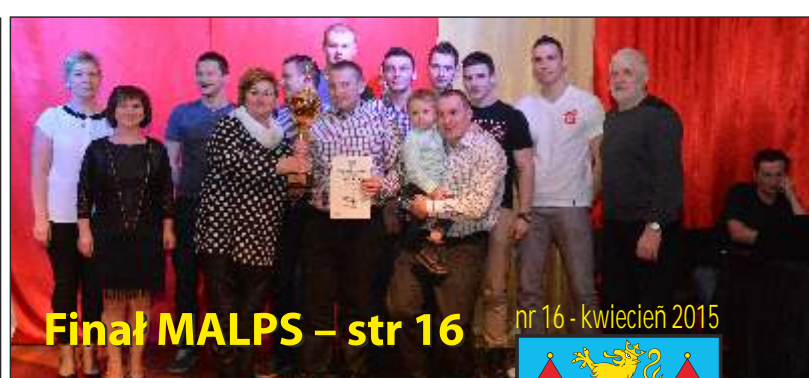
Finał MALPS – str 16