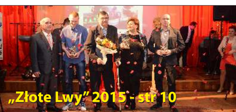
„Złote Lwy” 2015 - str 10