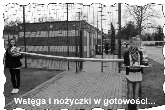
Wstęga i nożyczki w gotowości...

A jeśli pomysł się uda, to na otwarciu sekcji były olimpijczyk zawita do Dębic z dwoma sportowymi rowerami.