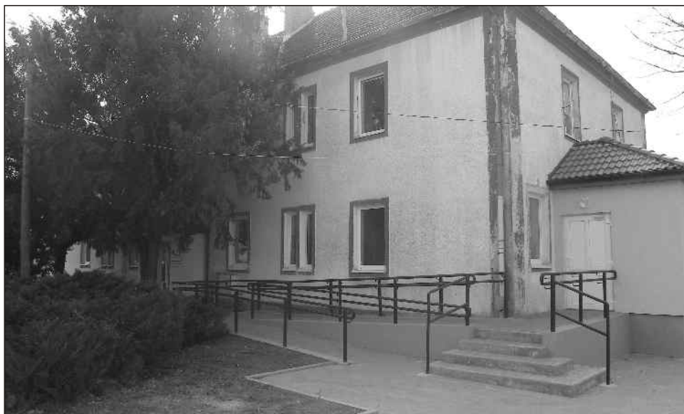
Ośrodek Zdrowia w Maszewie

dniego funkcjonowania Punktu Zdrowia w Rożnowie, uwzględniając potrzeby mieszkańców Gminy, a w szczególności sołectw: Rożnowa, Dąbrowicy, Zagórcze, Tarnowa, Przemocza i Darża, Gmina Maszewo partycypuje w kosztach jego utrzymania oraz zaplanowała przeprowadzenie remontu pomieszczeń, w tym: wymianę stolarki okiennej i drzwiowej.