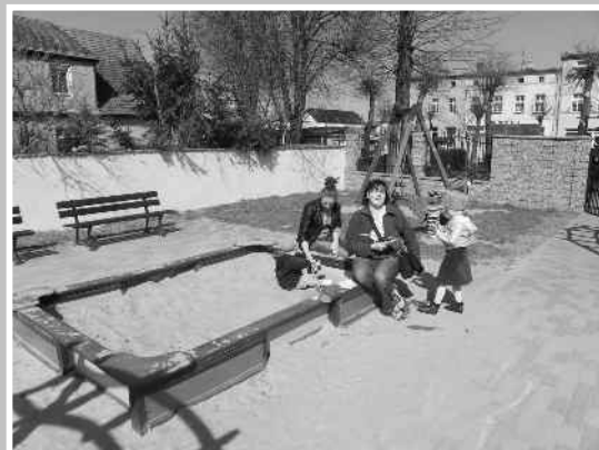
Plac przy ul.H.Sawickiej

Przyszła wiosna, nareszcie! Zrobiło się ciepło, zazieleniły się drzewa. Dzieci wychodzą na place zabaw. Na placu zabaw w Maszewie przy ul. H.Sawickiej wraz z nadejściem wiosny, przeprowadzono konserwację urządzeń zabawowych, wykonano kosmetyczne usterki. Plac wyposażony jest w profesjonalne i bezpieczne certyfikowane urządzenia, są to m.in.: huśtawki, karuzela, bujak, piaskownia oraz zestaw, na którym dzieci poćwiczyć mogą swoją sprawność fizyczną. Nie brakuje również ławek i stołu dla rodziców i opiekunów, którzy wraz z dziećmi chętnie przychodzą zaczerpnąć świeżego, wiosennego powietrza. Ogrodzenie całego terenu placu zabaw oraz stabilne urządzenia sprawiają, że rodzice i opiekunowie nie muszą się martwić o bezpieczeństwo swoich pociech podczas zabawy. Plac zabaw, który usytuowany jest w centrum naszego miasteczka powstał w maju 2008 roku i cieszy się ogromną popularnością wśród najmłodszych mieszkańców. Na terenie miasta są jeszcze trzy place zabaw na ul. 1 Maja, Leśnej i Moniuszki.