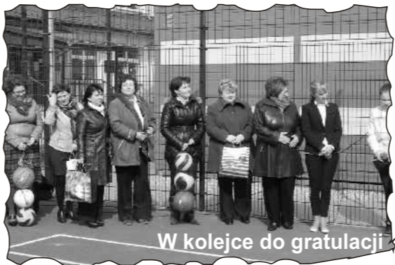
W kolejce do gratulacji