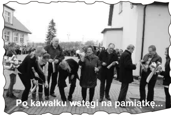
Po kawałku wstęgi na pamiątkę...