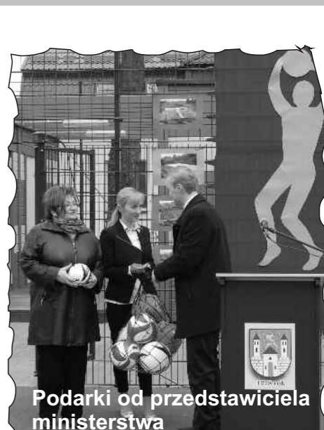
Podarki od przedstawiciela ministerstwa