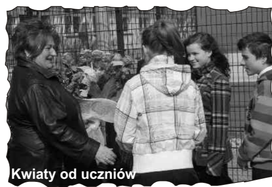
Kwiaty od uczniów