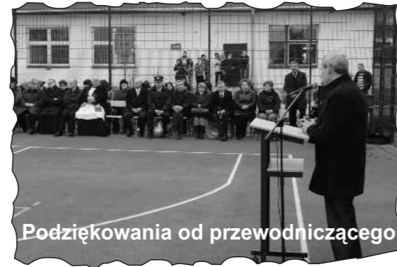
Podziękowania od przewodniczącego