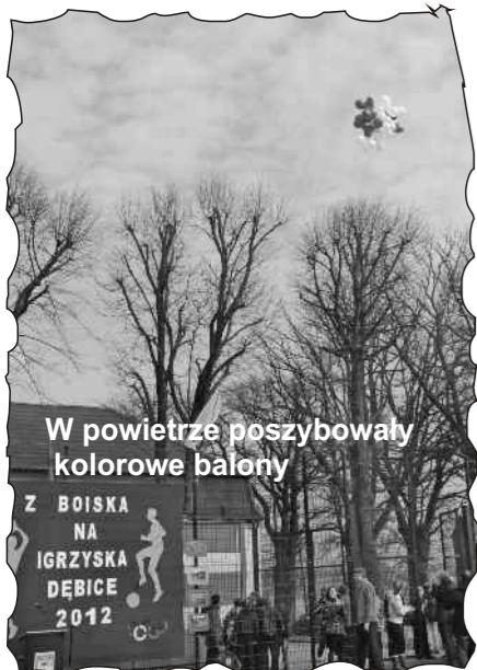
W powietrze poszybowały kolorowe balony