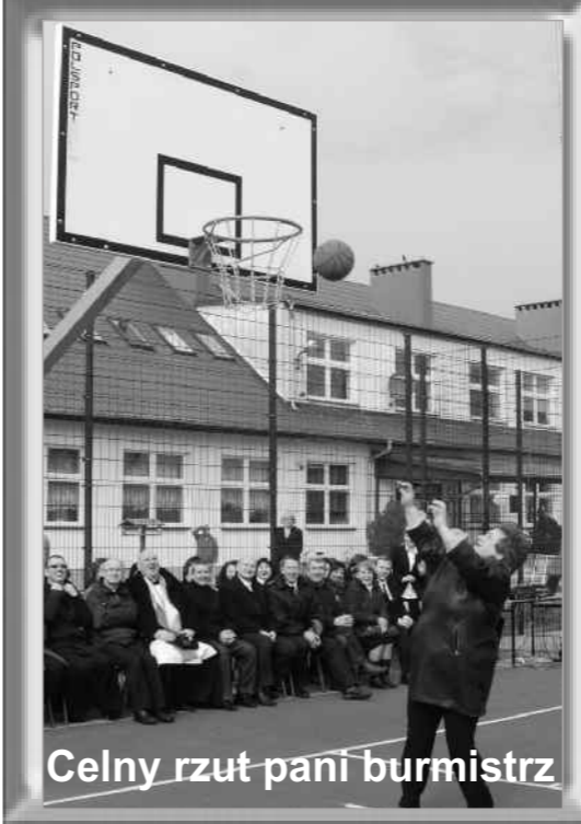
Celny rzut pani burmistrz