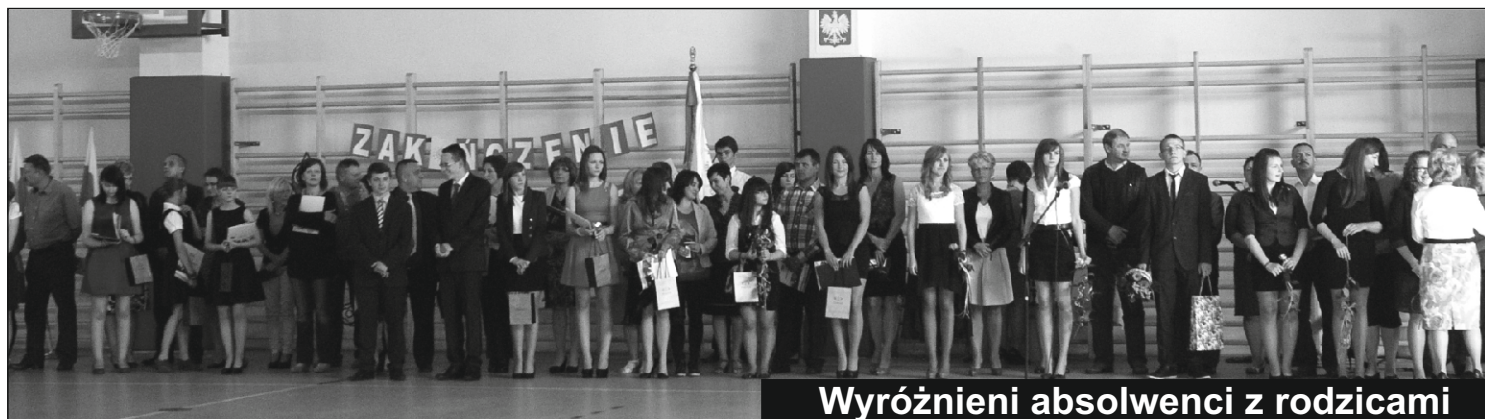
Wyróżnieni absolwenci z rodzicami