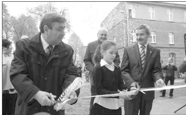
Z otwarcia hali cieszyliśmy się wszyscy

Jesteśmy dumni z podjętego wyzwania i cieszymy się, że hala spełnia oczekiwania mieszkańców, a przede wszystkim służy dzieciom i młodzieży.