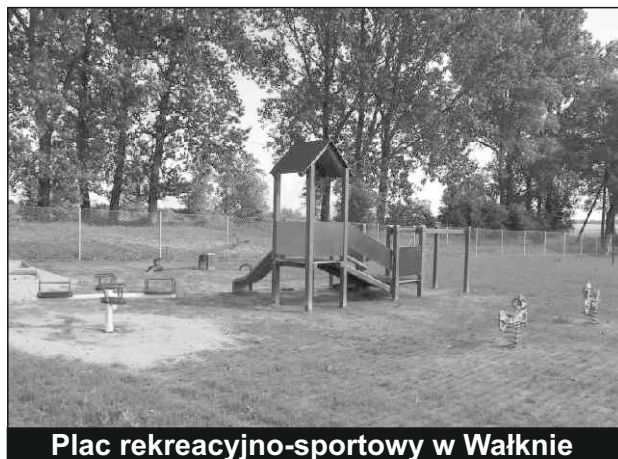
Plac rekreacyjno-sportowy w Wałknie