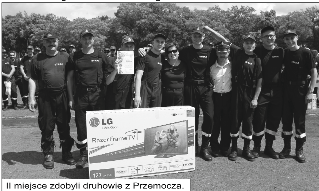
II miejsce zdobyli druhowie z Przemocza.

W sobotę 22 czerwca 2013 r. w Goleniowie odbyły się powiatowe zawody sportowo – pożarnicze. Strażacy ochotnicy walczyli o Puchar Komendanta Powiatowego PSP w Goleniowie oraz cenne nagrody tj. Telewizor, rzutnik multimedialny oraz laptop. Każda startująca drużyna otrzymała aparat cyfrowy. Zwycięstwo przypadło druhom z Węgorzy, ale nasze drużyny wypadły równie dobrze. Drugie miejsce zajęło OSP Przemocze, a trzecie OSP Rożnowo. Nagrody zwycięzcom wręczył Starosta Goleniowski, Komendant Powiatowy Państwowej Straży Pożarnej w Goleniowie, Prezes Zarządu Oddziału Powiatowego ZOSP w Goleniowie oraz burmistrzowie i wójtowie gmin. Gratulujemy sukcesu naszym druhom i cieszymy się wysokimi pozycjami.